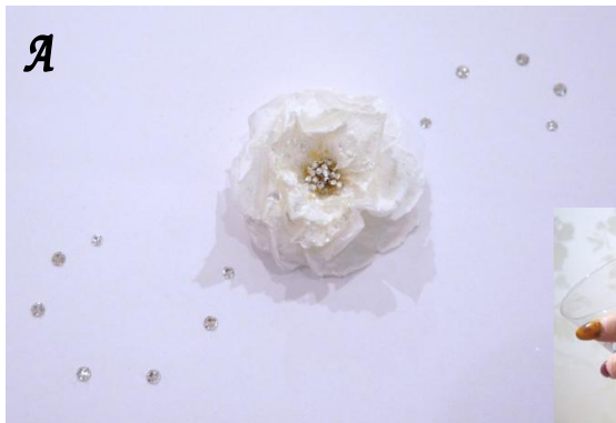
コーティングジュエルフラワーA カラー：ホワイト

カラーもピンクとホワイトの2色をご用意しておりますので、お選び頂いたジュエルに合わせて お好きなフラワーカラーとスタイル を組み合わせる素敵なドレスコーディネートで当日をお迎え下さい。