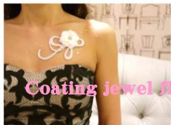
Coating jewel flower

☆可愛らしい雰囲気が漂うピンクカラー。お友達に自慢したくなるキュンとするドレススタイルに。